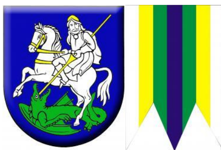
Obrázok 1: Erb a vlajka obce Bobrovec

Medzi základné symboly obce Bobrovec patrí erb, pečať a vlajka. Pri výtvarnom spracovaní erbu obce Bobrovec sa vychádzalo zo zachovaných podkladov - odtlačkov pečatí a pečiatky. Popri kruhopise je na všetkých jednoznačne viditeľná postava svätého Juraja na koni s kopijou, v jednom prípade je na odtlačku postava stojaca. Svätý Juraj bol legendárny bojovník a mučeník, býva oblečený ako rímsky legionár, neskôr ako rytier v stredovekom brnení. Sedí na bielom koni - biela symbolizuje čistotu - nad hlavou máva mečom, zlomená kopija leží na zemi, jej časť niekedy trčí z hrdla či tlamy obludy.