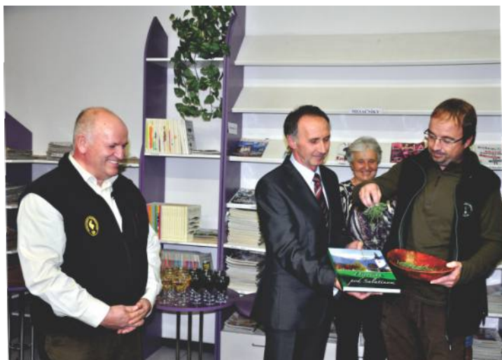
• Víťanie knihy „Divočina pod Salatínom“