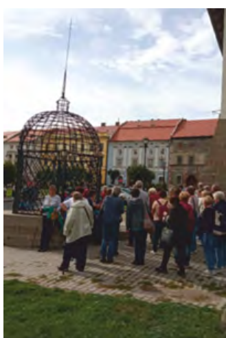
• Klieťka hanby