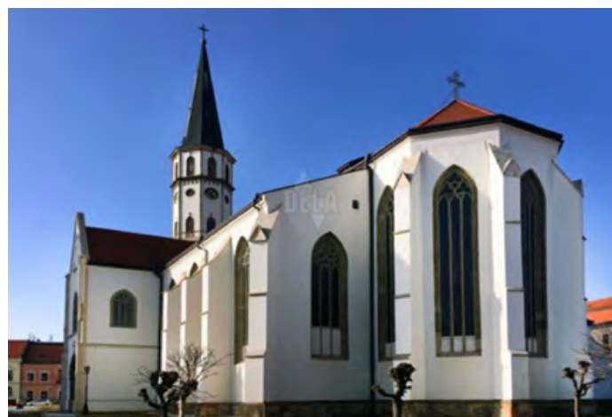
• Chrám sv. Juraja