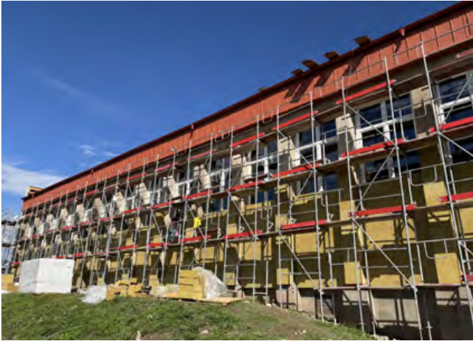
• Rekonštrukcia telocvične ZŠ