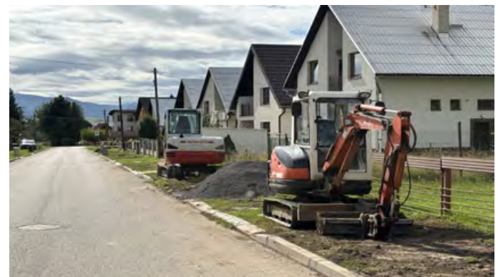
• Výmena vodovodného potrubia Dolné sklady

Keďže stravníkov je dosť, práce spojené s inštalovaním novej technológie budú realizované bez väčšieho narušenia prevádzky jedálne, teda najmä počas víkendov.