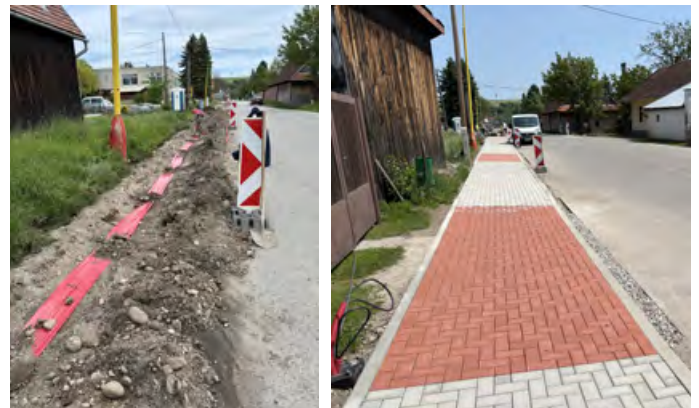
• Opravený chodník smer COOP Jednota

50x50 cm. Povrch už bol značne narušený. V súčasnosti ho nahradila zámková dlažba a v rámci rekonštrukcie bolo na tomto úseku vymenené aj verejné osvetlenie. Takto bol zveľadený ďalší kúsok obce.