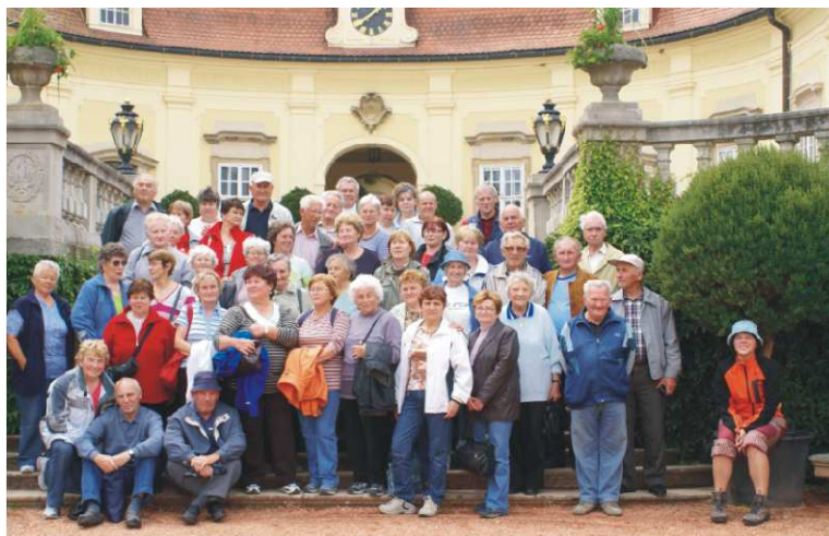
Návšteva zámku v Buchloviciach

Odtiaľ nás autobus priviezol do Buchlovíc.