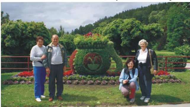
Návšteva z kúpeľov v Luhačovičiach

Autobusom sme vyšli o 5-tej hodine rannej a po krátkej zastávke v Žiline sme pokračovali k prvej zastávke Vizovice, kde sme si kúpili malé darčkové pozornosti. Ďalšia zastávka viedla do krásnych kúpeľov v Luhačovičiach. Kúpele so svojimi jedinečnými minerálnymi prameňmi, ktorých v regióne napočítate hneď pätnásť - 14 hydrogenuhličitanochloridosodných kyseliek a jeden sírny prameň, sú považované za najkrajšie moravské kúpele a nie neprávom sú nazývané Perlou Moravy. Pečať jedinečnosti im vtisla architektúra miestneho kúpeľného komplexu zo začiatku minulého storočia, vybudovaného podľa