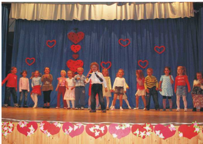
Z vystúpenia v KD

Naše deti chodia radi do škôlky, lebo im je tam dobre. Starajú sa o nich p. učiteľky, p. kuchárky a p. školníčka. Celé dni sa iba hrajú, kreslia, maľujú, lepia, strihajú, spievajú, cvičia a veselo si poskakujú. Keď prídu domov zase sa o nich starajú otec, mama a starí rodičia, ktorí s láskou urobia pre nich všetko, aby boli zdravé a šťastné. Preto im patrí veľká vďaka za ich lásku, starostlivosť a obetavosť. Dňa 7. 6. 2009 pri príležitosti Dňa rodiny škôlkári pozvali svojich najbližších do kultúrneho domu, aby im mohli poďakovať. S veľkou nedočkavosťou čakali na začiatok programu, kedy už budú môcť vystupovať. Potom básničkám, scénkam, piesňam a tančekom akoby ani nebolo konca. Počas programu si mamičky, ockovia i starí rodičia posedeli, oddýchli, popočúvali program, ktorý pani uč. spolu s deťmi takto pekne pripravili len pre nich. V niektorých očiach rodičov aj starých rodičov som si všimla slzičky. Boli to však slzy šťastia. A pekne sa leskli. Keď odchádzali domov, dostali od detí malý darček-medovníkové srdiečko z lásky.